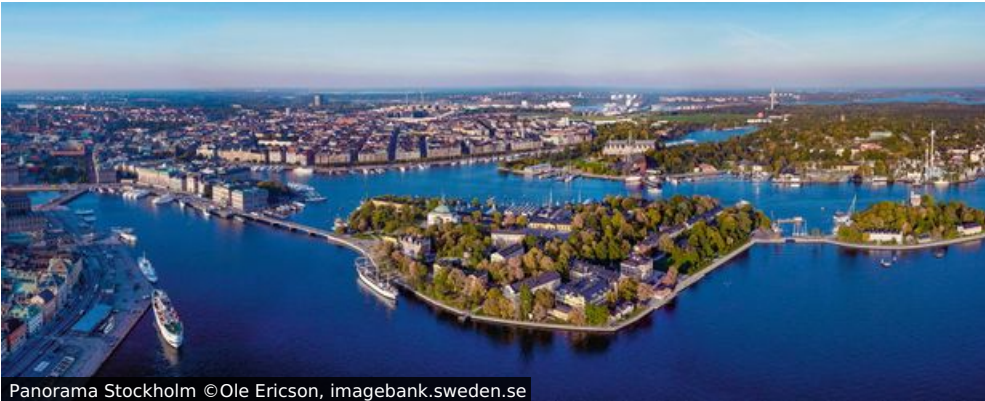
Panorama Stockholm