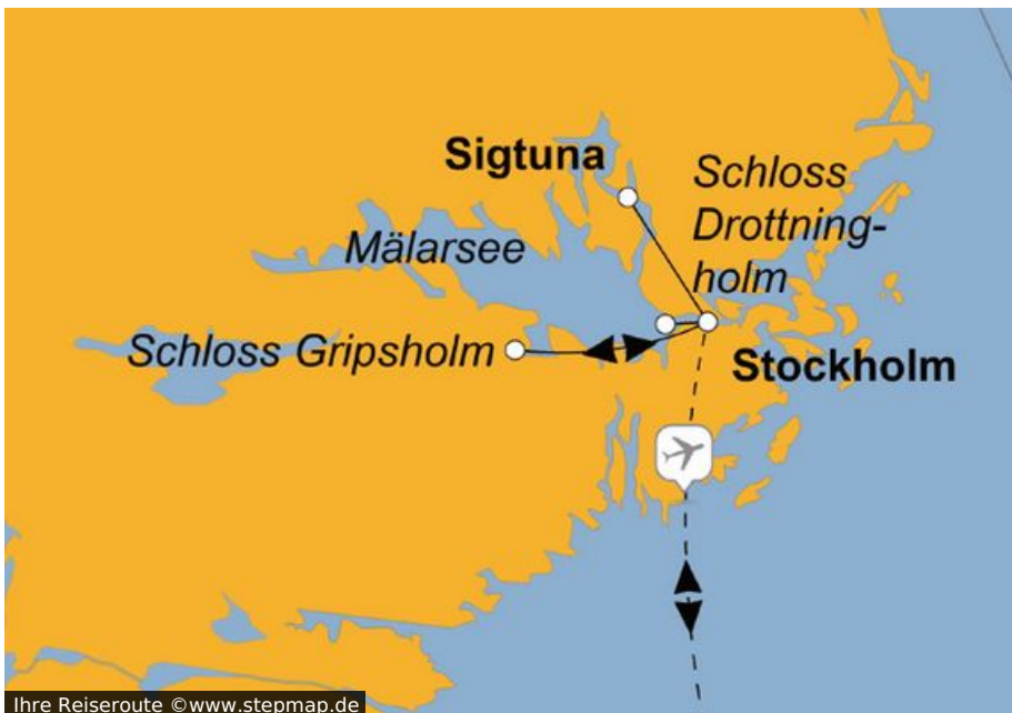
Ihre Reiseroute

„Venedig des Nordens“, „Kleinste Großstadt der Welt“, „Hauptstadt von ABBA-Land“ - Stockholm hat so viele Beinamen wie Inseln. Und reichlich viel Wasser drum herum.