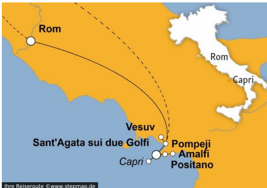
Ihre Reiseroute

Italien ist so facettenreich, als wäre es eine Welt im Kleinen. Überzeugen Sie sich selbst und kommen Sie mit auf unsere italienische Weltreise. Über die Alpengipfel in das milde Klima im Schatten der Berge am Gardasee, durch die sanft hügelige, duftende Toskana und das landwirtschaftlich geprägte Umbrien, ins Latium mit der ewigen Stadt Rom im Zentrum und weiter in das feurige Kampanien mit Neapel, Capri, dem Vulkan Vesuv und der antiken Stadt Pompeji.