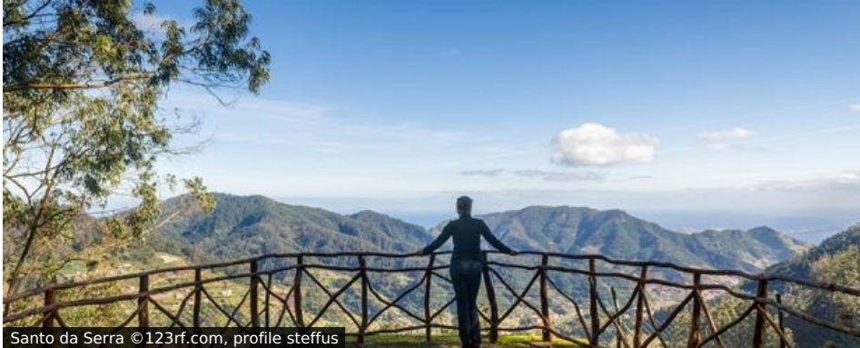
Santo da Serra