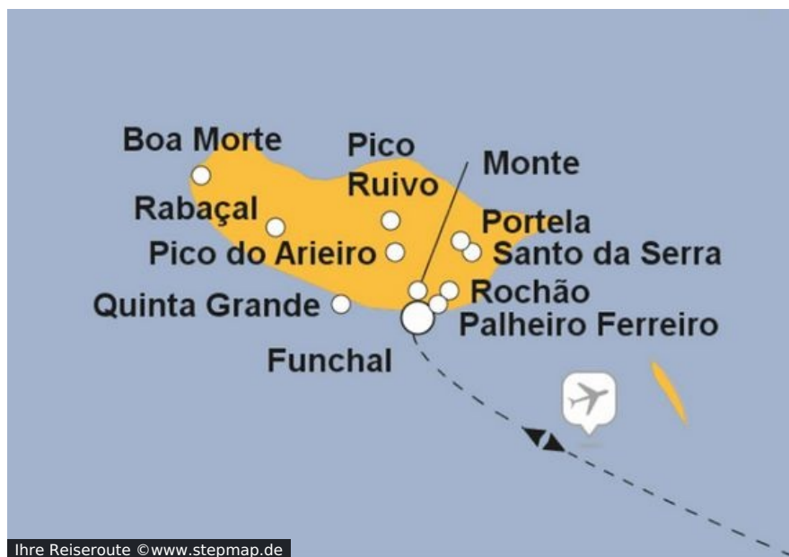
Ihre Reiseroute

Portugals Paradies heißt Madeira. Eine Insel, die sich in punkto Vegetation verschwenderisch zur Schau stellt. Für die faszinierenden Schönheiten, die sich hier über die Täler, Berge und Hügel ergießen, darf man ruhig das Tempo drosseln. „Der Weg ist das Ziel“, wie Konfuzius einst sagte. Recht hat er. Auf dieser immergrünen, immer blühenden Insel mitten im Atlantischen Ozean haben Sie auf Schritt und Tritt das Gefühl, angekommen zu sein.