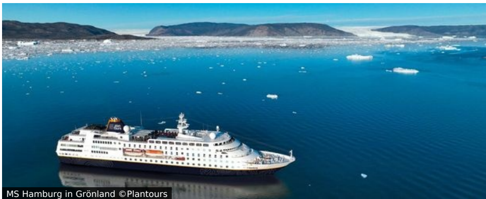
MS Hamburg in Grönland

Die MS HAMBURG schreibt ein Kapitel der unvergesslichen Kreuzfahrt. Sie steht für das Beste aus zwei Welten: Klein und fein. Komfortabel und leger. Individuell und kommunikativ. Stilvoll und sportlich. International und deutschsprachig. Weltoffen und privat.