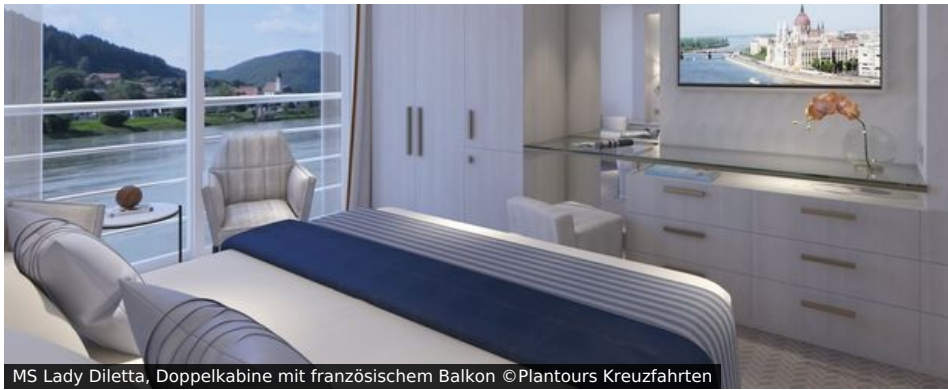
MS Lady Diletta, Doppelkabine mit französischem Balkon