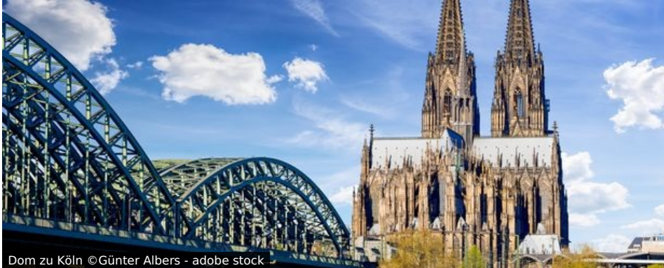
Dom zu Köln