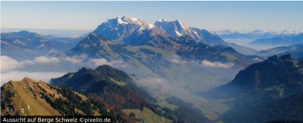
Aussicht auf Berge Schweiz