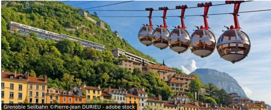
Grenoble Seilbahn