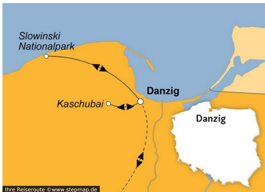
Ihre Reiseroute

Die „Perle der Ostsee“ liegt an der Mündung der Weichsel. Danzig - bedeutende Hansestadt des Mittelalters, Anfang des letzten Jahrhunderts freie Stadt, zum Ende des Ostblocks Ausgangspunkt der polnischen Demokratiebewegung - die Stadt glänzt in schönster Pracht und präsentiert seine reiche Geschichte.