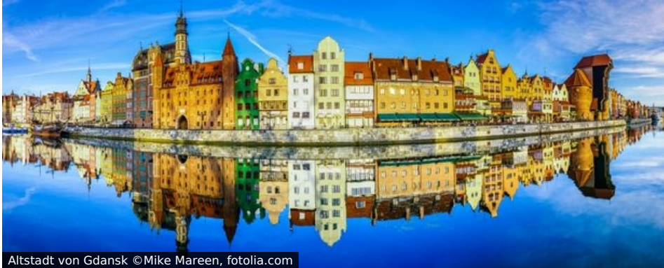
Altstadt von Gdansk