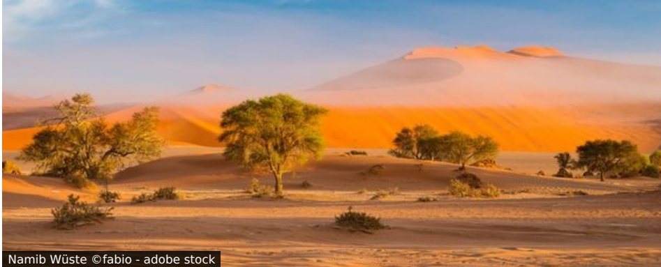
Namib Wüste