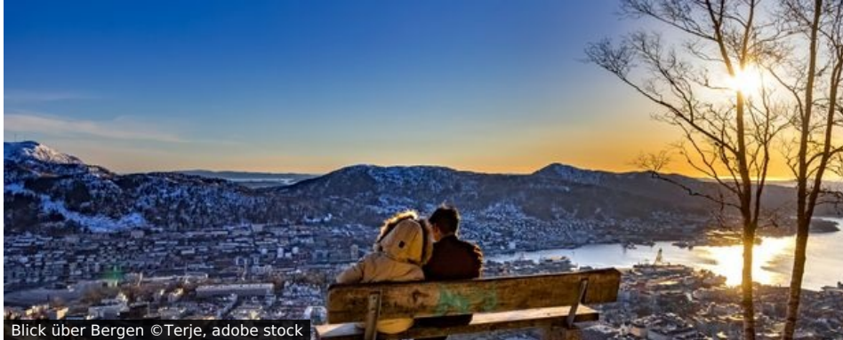
Blick über Bergen