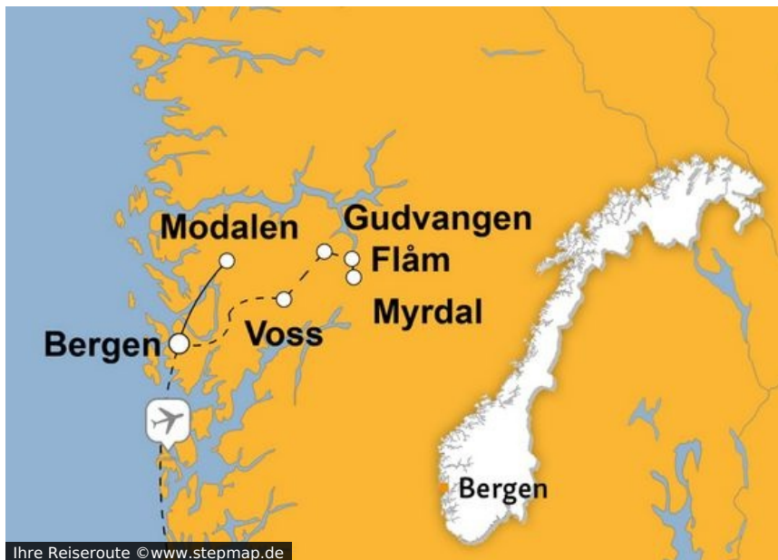
Ihre Reiseroute

Manchmal machen drei kleine Buchstaben einen großen Unterschied. Beispiel gefällig? Wenn Sie Ihren Silvesterurlaub nicht in "den" Bergen, sondern einfach "in" Bergen verbringen, genießen Sie zwar auch rundum verschneite Gebirgslandschaft - aber eben noch viel mehr. Denn Bergen ist nicht nur die norwegische „Stadt zwischen den sieben Bergen“, sondern auch das sprichwörtliche „Herz der Fjorde“, stolze Hansestadt, maritime Schönheit und Ausgangspunkt für unvergessliche Ausflüge.