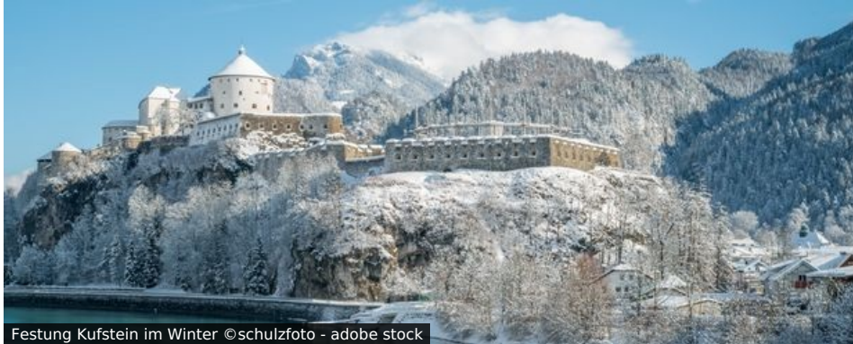
Festung Kufstein im Winter