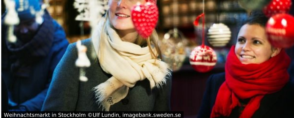
Weihnachtsmarkt in Stockholm

Wer einmal zur Adventszeit im blaugelben Möbelhaus eingekauft hat, weiß, dass die Schweden eine ganz besondere und stimmungsvolle Beziehung zur Advents- und Weihnachtszeit pflegen. Höchste Zeit, den „Glögg“ (Glühwein), das „Julbord“ (Weihnachtsbüffet) und die Lichterpracht im Vorfeld des Lucia-Tages einmal im Original zu erleben und nicht in Papptüten nach Hause zu tragen.