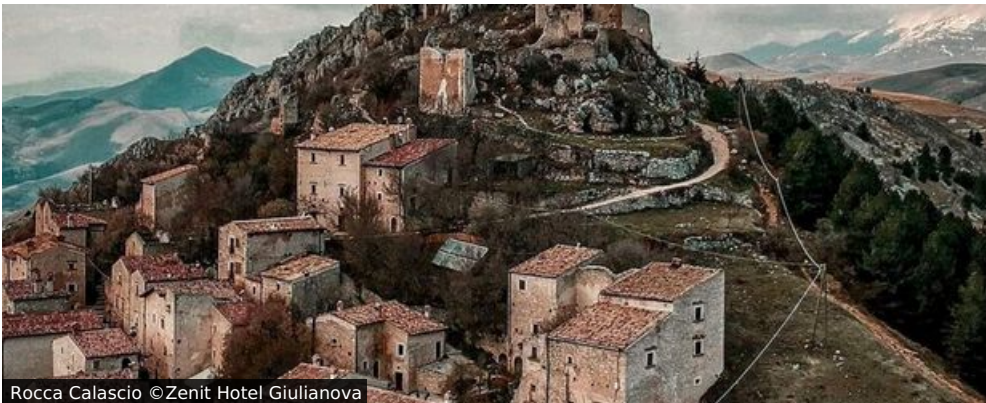
Rocca Calascio