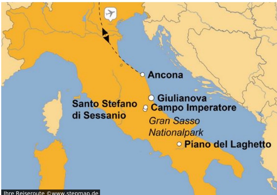
Ihre Reiseroute

„Mare e Monti“ - Meer und Berge vereinen sich in der Küche der Abruzzen ebenso wie in der Landschaft dieses wunderschönen Landstrichs an der „Wade“ des italienischen Stiefels. Denn hinter dem ca 150 Kilometer langen Küstenstreifen an der italienischen Adria, an dem auch ihr Hotel liegt, erhebt sich der Abruzzische Apennin, der im Gebirgsmassiv Gran Sasso d' Italia und dem höchsten Gipfel Corno Grande bis fast 3000 Meter in den Himmel ragt.