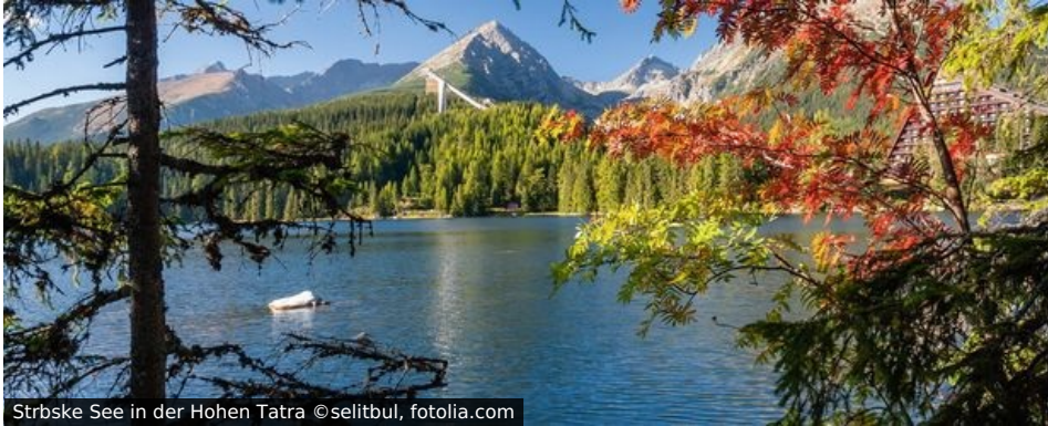
Strbske See in der Hohen Tatra