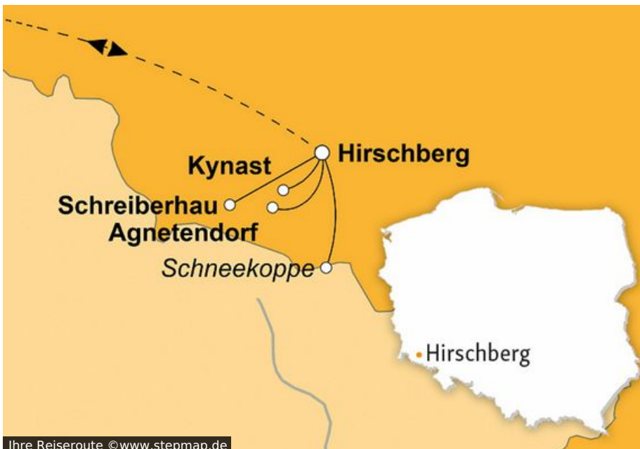
Ihre Reiseroute

Wenn Ihnen beim Gedanken an ein kühles Staropramen das Wasser im Mund zusammenläuft, müssen sie ganz tapfer sein: denn das ähnlich klingende „Pramen Labe“ ist nicht etwa eine weitere Brauspezialität, sondern der Name der Elbquelle, die nahe Spindlermühle im Riesengebirge den Ursprung des großen europäischen Stroms markiert. Die hiesige Aussichtsplattform, wo die Wappen der tschechischen und deutschen Anrainerstädte in Steinmosaiken verewigt sind, ist eines der Wanderziele, die wir auf unserer sechstägigen Reise besuchen wollen. Aber keine Sorge: weil Wandern durstig macht, besuchen wir auch eine Minibrauerei zur Erhaltung unseres Flüssigkeitshaushaltes und verkosten verschiedene Biere.