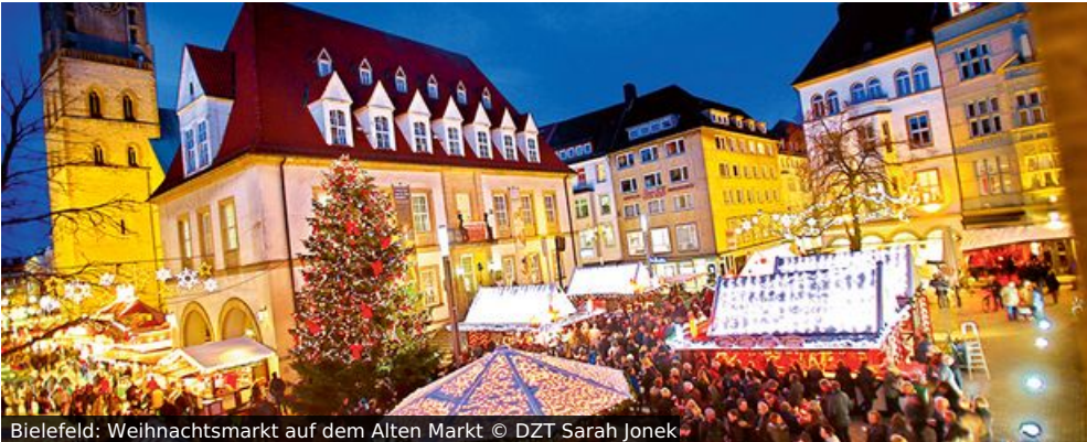
Bielefeld: Weihnachtsmarkt auf dem Alten Markt