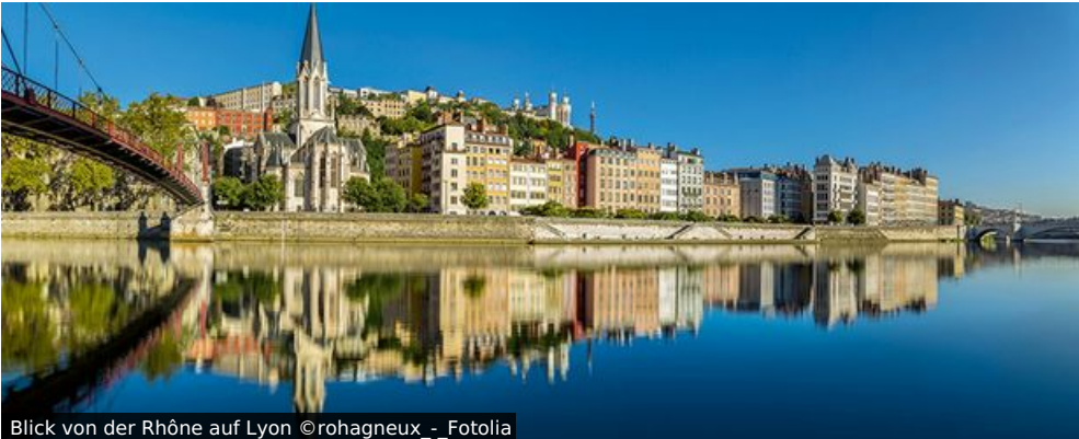
Blick von der Rhône auf Lyon