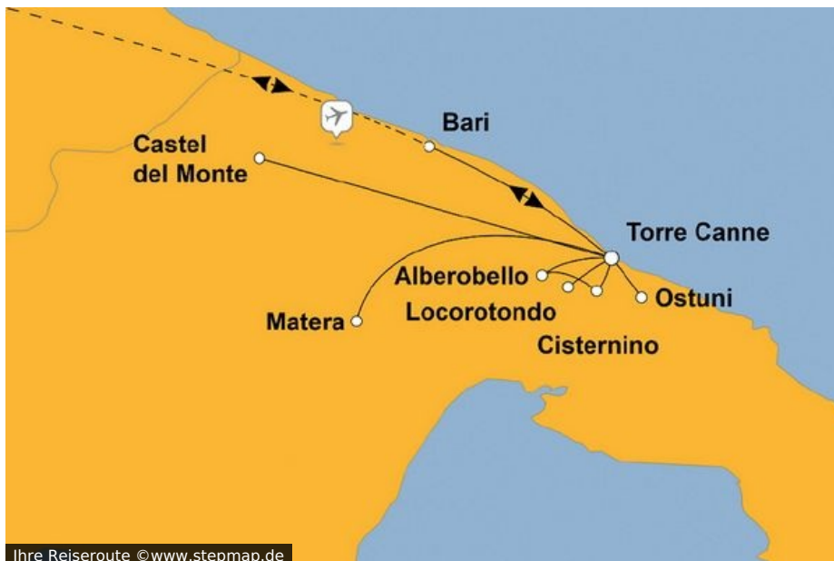
Ihre Reiseroute

Das südliche Italien ist noch immer ein Geheimtipp in vielen Wanderführern. Ob Kalabrien, die Basilikata oder Apulien – Hacke, Spitze und Knöchel des italienischen „Wanderstiefels“ zeigen eine Schönheit und Ursprünglichkeit, welche man am Strand von Rimini wohl kaum findet. Zwischen Adria und Ionischem Meer erwacht die Landschaft aus seinem Dornröschenschlaf und lädt uns zu Wanderungen auf unbekanntem Pfaden ein.