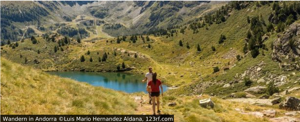
Wandern in Andorra