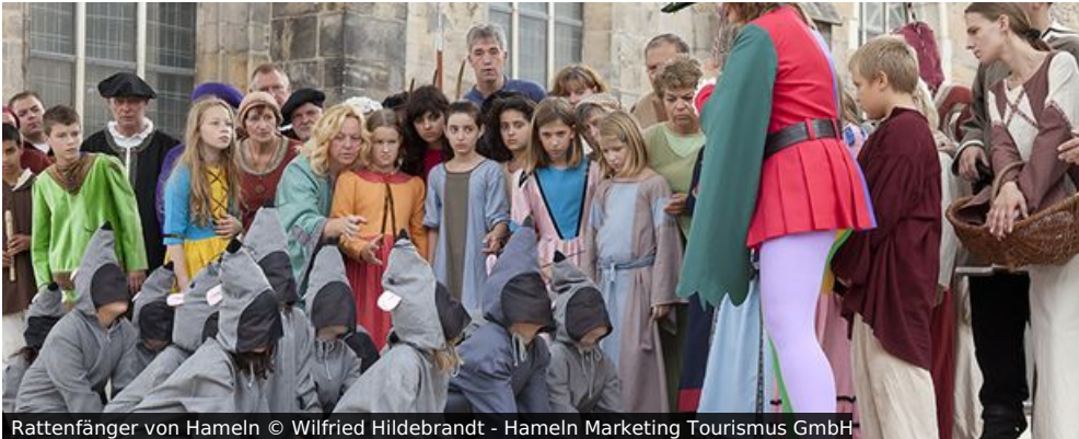
Rattenfänger von Hameln