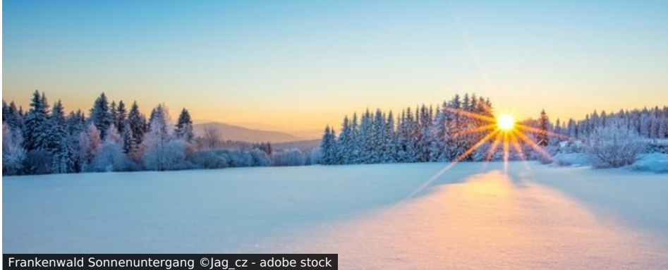
Frankenwald Sonnenuntergang