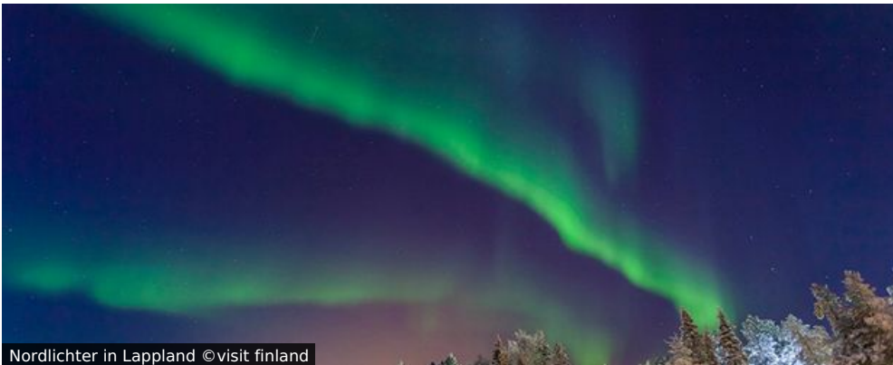
Nordlichter in Lappland