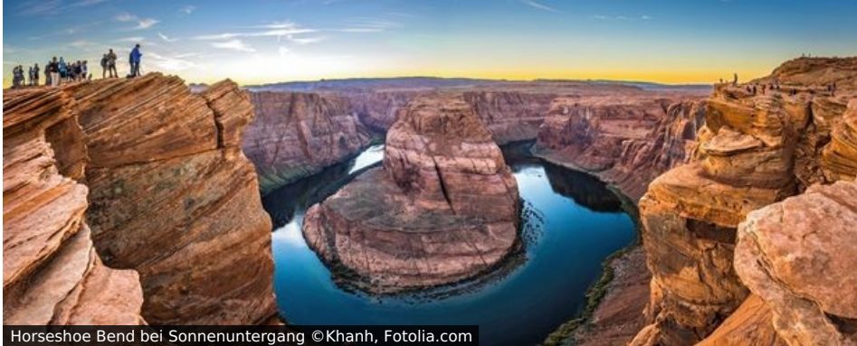
Horseshoe Bend bei Sonnenuntergang