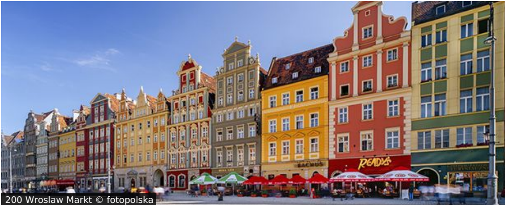
200 Wroslaw Markt