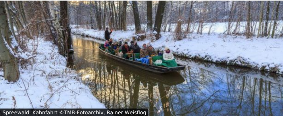
Spreewald: Kahnfahrt