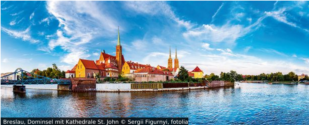
Breslau, Dominsel mit Kathedrale St. John