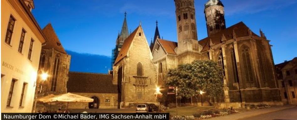
Naumburger Dom