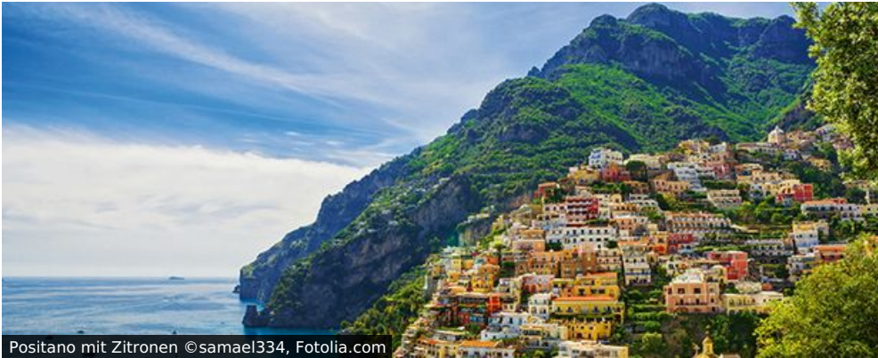
Positano mit Zitronen