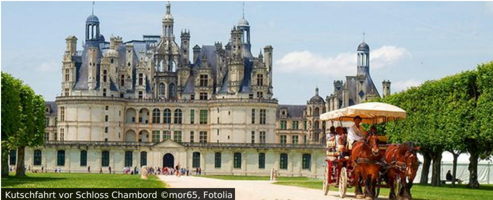
Kutschfahrt vor Schloss Chambord