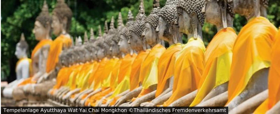
Tempelanlage Ayutthaya Wat Yai Chai Mongkhon