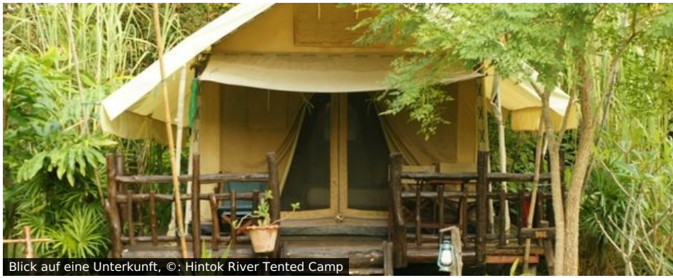
Blick auf eine Unterkunft, ©: Hintok River Tented Camp

Lage: Das Zeltcamp liegt idyllisch direkt am River Kwai inmitten der unberührten Natur des Erawan Nationalpark. Die klimatisierten Zelte sind mit komfortablen Betten, privater Dusche/WC, Kühlschrank und privater Veranda ausgestattet