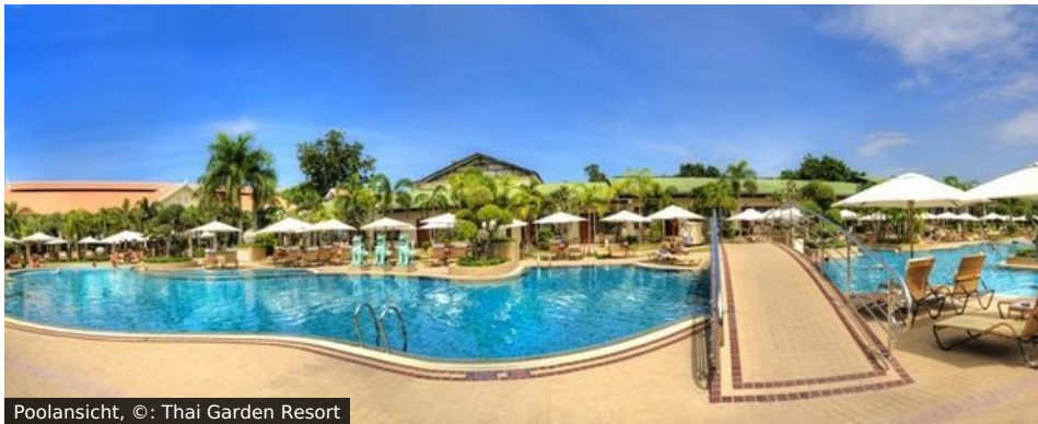
Poolansicht, ©: Thai Garden Resort