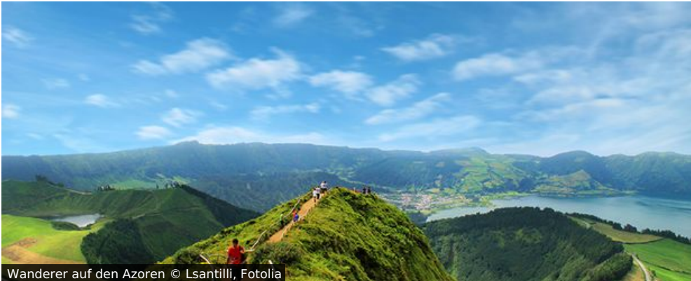
Wanderer auf den Azoren