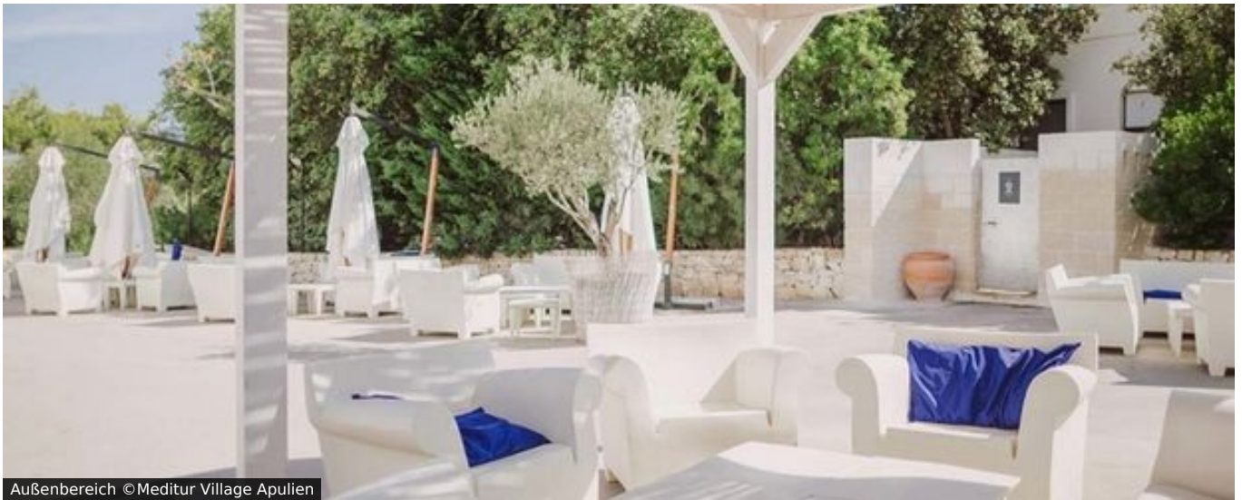
Außenbereich ©Meditur Village Apulien