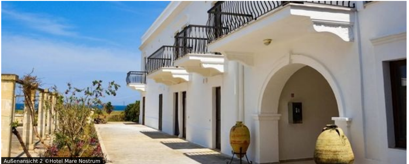
Außenansicht 2