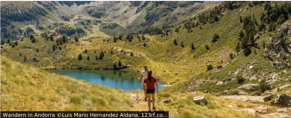
Wandern in Andorra

Zwergstaat - mit diesem Attribut wird Andorra wohl am häufigsten assoziiert.