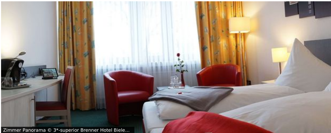
Zimmer Panorama © 3*-superior Brenner Hotel Bielef...