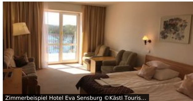
Zimmerbeispiel Hotel Eva Sensburg