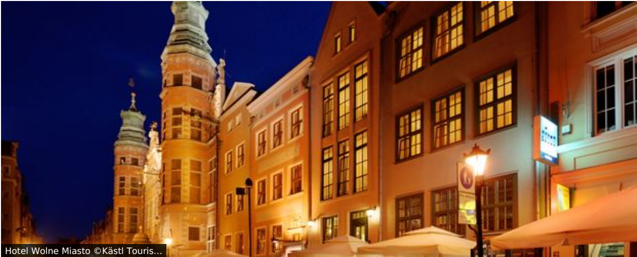
Hotel Wolne Miasto