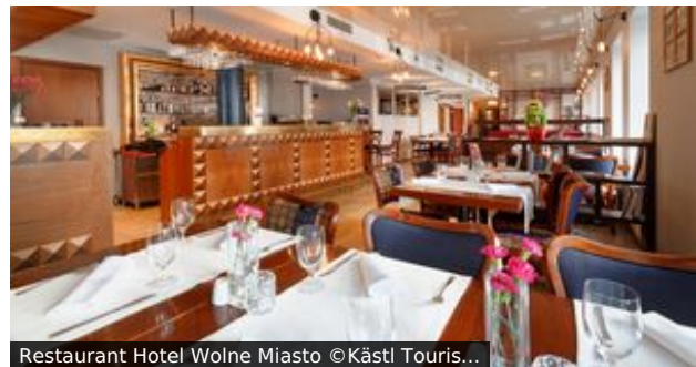
Restaurant Hotel Wolne Miasto