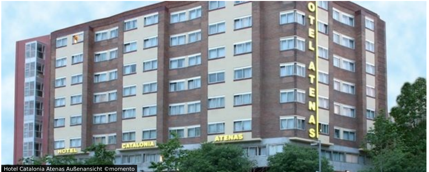
Hotel Catalonia Atenas Außenansicht