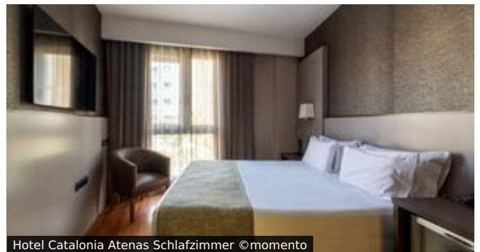
Hotel Catalonia Atenas Schlafzimmer

Lage & Ausstattung: Nur ca. 20 Gehminuten von der Sagrada Familia entfernt, erreicht man von hier aus auch alle übrigen Sehenswürdigkeiten mit dem öffentlichen Nahverkehr. In der Umgebung gibt es eine Vielzahl an Restaurants, Bars und Shops. Auf dem Dach des Hotels befindet sich ein kleiner Pool (saisonal, wetterabhängig) mit Terrasse, von der man eine schöne Aussicht über die Dächer der Stadt hat. An der Bar kann man einen erlebnisreichen Tag entspannt ausklingen lassen.